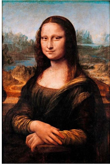
Public Domain Mark